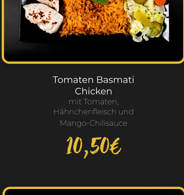
Tomaten Basmati Chicken mit Tomaten, Hähnchenfleisch und Mango-Chilisauce