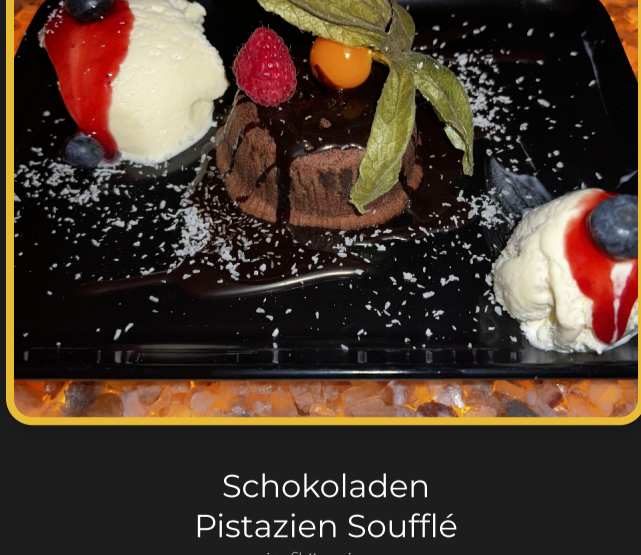
Salat Mix Chicken mit Hähnchen, Käse, Olivenöl und Balsamico-Essig