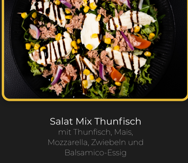
Grilled Beef Cheese Wrap